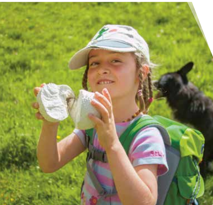
Lenaelle beim Boviste Sammeln; Tête de Vautisse, Durancetal, Frankreich; Photo: StefanNeuhauser.com